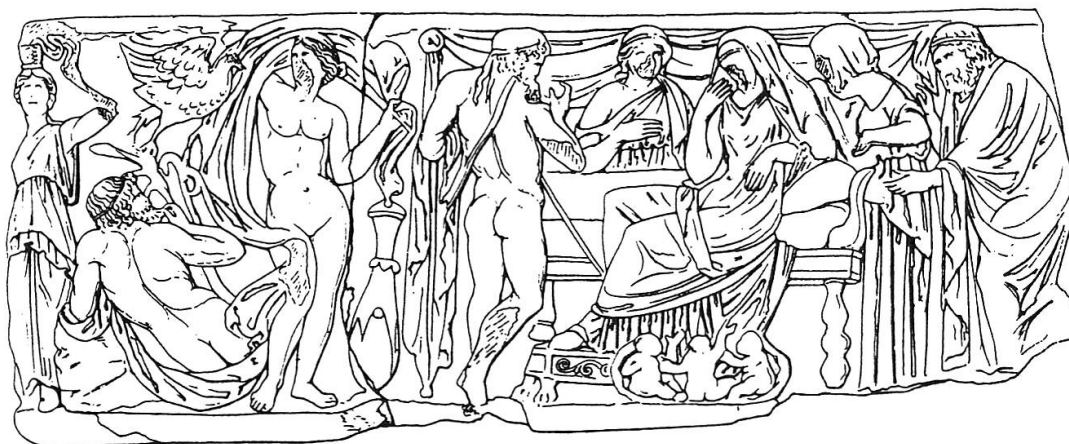
Fig. 6. Sarcophage de marbre, Aix-en-Provence, Musée Granet (2 e s. apr. J.-C.). D'après LIMC IV, 1988, 504, n o 11.

s'apprête à s'unir au cygne; à droite, elle regarde, assise sur un lit, la naissance des triplés qui émergent de la coquille brisée de l'œuf 89 .