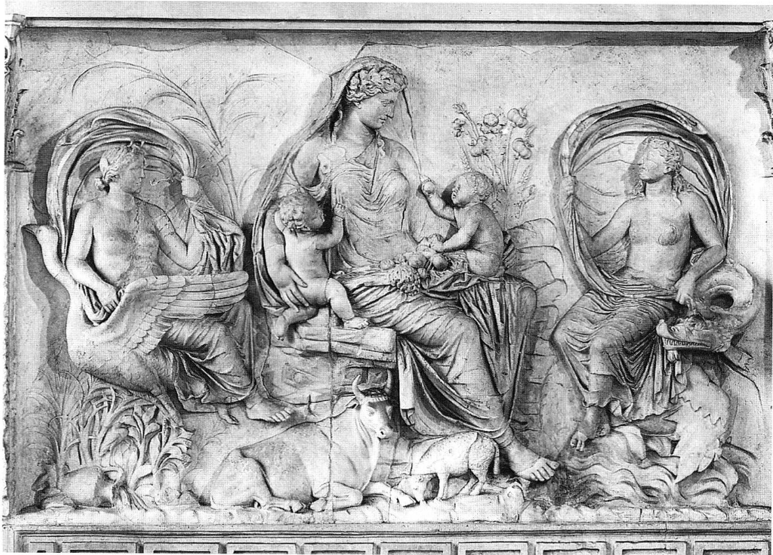
Fig. 2. Ara Pacis Augustae, Rome (13–9 av. J.-C.).

l' Ara Pacis Augustae , cet autel monumental érigé en 13 av. J.-C. pour célébrer l'œuvre pacificatrice d'Auguste (fig. 2). La figure féminine centrale personnifie la Terre nourricière; elle est entourée de symboles de prospérité et de fertilité, des fleurs, des fruits, des animaux; deux jumeaux potelés sont assis dans son giron, gages d'abondance et de fécondité. Cette célébration de la gémellité est aussi présente dans le monnayage impérial. Marc-Aurèle fit ainsi frapper un sesterce pour commémorer la naissance, le 31 août 161, de ses fils jumeaux, le futur empereur Commode et son frère Antonin. Le type montre l'impératrice Faustine la Jeune en Felicitas debout, portant les jumeaux dans ses bras et entourée de ses quatre fillettes 14 .