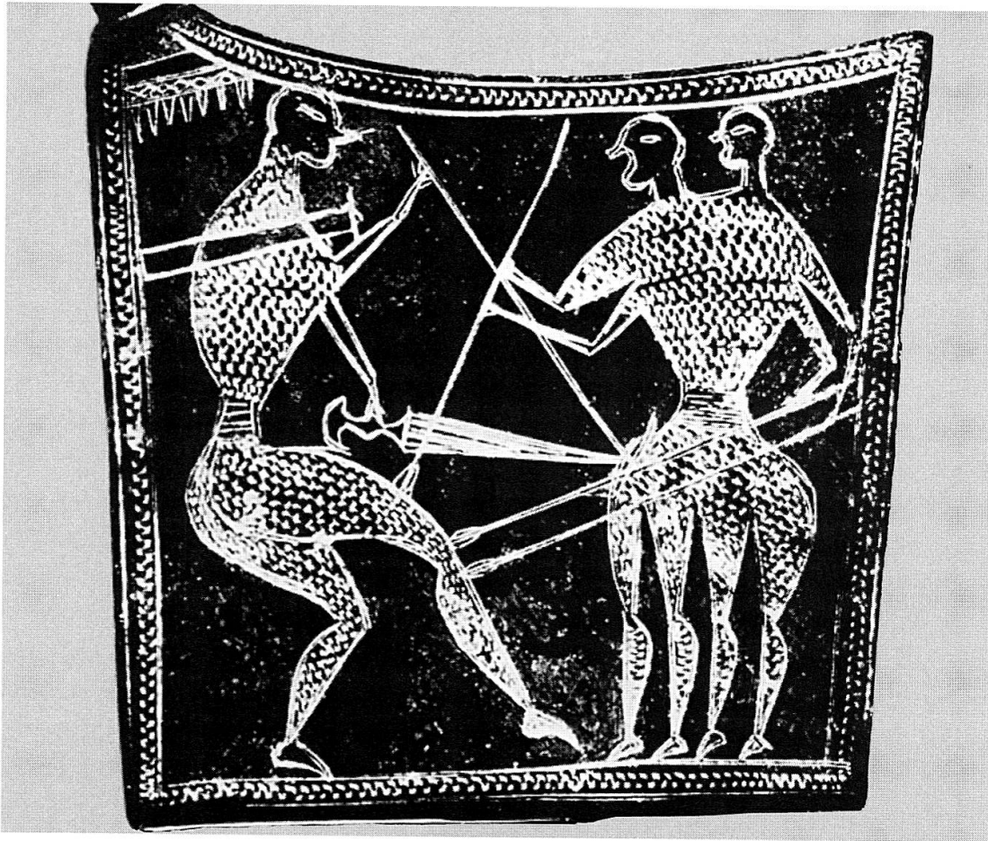
Fig. 5. Fibule en bronze (début du 7 e s. av. J.-C.). Athènes, Musée national 11765. D'après LIMC I, 1981, pl. 364, n° 7.

aussi que certaines poules ne pondent que des œufs à deux jaunes, et que sur une ponte de dix-huit œufs doubles éclôt un poussin monstrueux 81 . Ses observations sont même très précises. Il note: «Lorsque les blancs sont séparés par la membrane, il naît deux poussins distincts qui n'ont rien de particulier. Mais quand ils sont contigus et que rien ne les sépare, il naît des poussins monstrueux, avec un seul corps et une seule tête, mais quatre pattes et quatre ailes (...).» 82 Le même raisonnement explique que ce type d'anomalie ne se produit jamais chez les abeilles et les guêpes, «car leurs œufs sont déposés dans des cellules séparées» 83 .