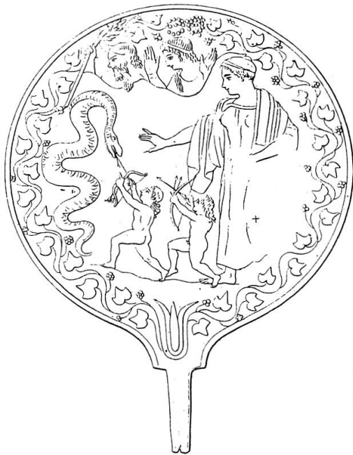
Fig. 4. Miroir étrusque (deuxième moitié du 5 e s. av. J.-C.). Rome, Villa Giulia 51109. D'après LIMC II , 1984, 339, n° 11.

On peut discerner les traces de cette idée reçue dans les textes non médicaux relatifs au destin de paires fraternelles formées d'un jumeau et d'une jumelle, comme les enfants du dictateur Sylla, Faustus et Fausta, et ceux d'Antoine et Cléopâtre, Alexandre-Hélios et Cléopâtre-Sélénè 56 . Ces jumeaux ne constituent un couple que grâce à leurs noms. Quant il s'agit d'évoquer leurs destins, les auteurs anciens n'évoquent jamais leurs ressemblances ou leur complicité fraternelle, comme si leur différence de sexe n'en faisaient pas de véritables jumeaux 57 . La mythologie dénombre d'ailleurs très peu d'exemples de couples de frère et sœur jumeaux 58 . Ces paires sont encore plus rares dans l'iconographie. Apollon et Artémis sont parfois gémeellisés, notamment dans l'iconographie étrusque. Un miroir provenant de la nécropole de Cerveteri (2 e moitié du 5 e s. av. J.-C.) montre ainsi Apollon attaquant avec sa sœur le serpent monstrueux qui pourchassait leur mère Léo (fig. 4). Mais ce document est inhabituel. Dans l'iconographie attique, seul le petit Apollon accomplit cet exploit; les imagiers du 5 e s. av. J.-C. le montrent dans les bras de sa mère, se redressant pour viser le serpent 59 .