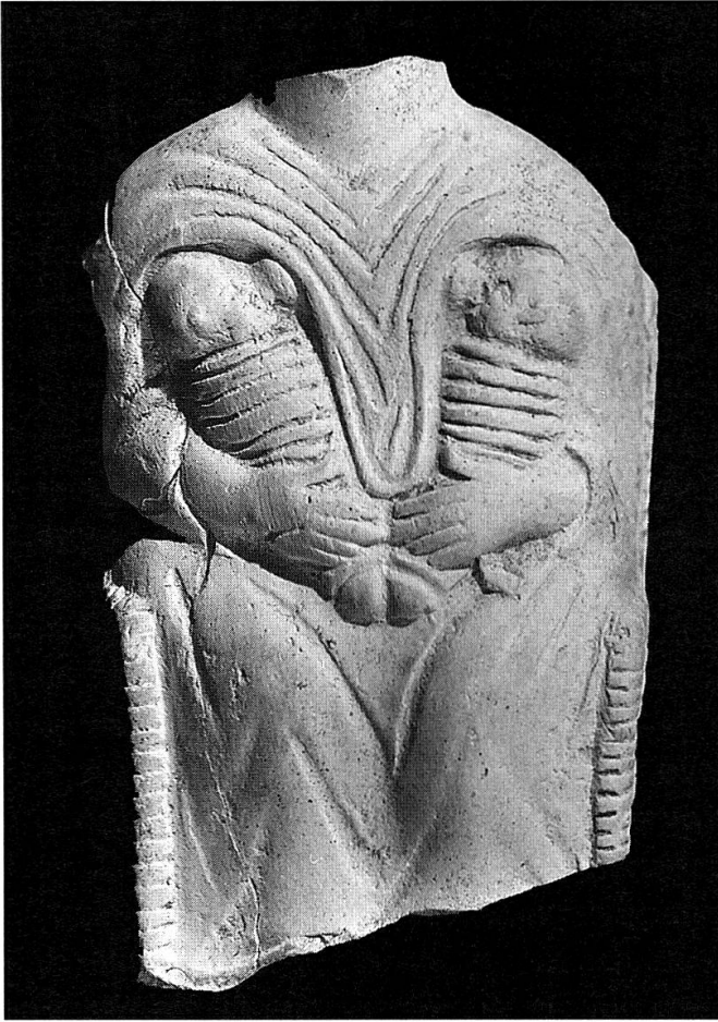
Fig. 1. Terre cuite. H. 8 cm (fin du 2 e s. ap. J.-C.). Avenches, Musée romain, inv. 65/9595.

figurines représentent une mère, assise dans un fauteuil en osier, en train d'allaiter deux bébés, un à chaque sein (fig. 1) 13 . Ces objets semblent avoir rencontré une extraordinaire popularité. Leur aire de diffusion est très large; on les rencontre en quantité innombrable dans toute la Gaule, en Bretagne et dans les Germanies, jusqu'au limes et même parfois au-delà, en Germanie libre. Les trouvailles se répartissent entre les nécropoles, les habitats et, plus rarement, les sites culturels, en particulier les sanctuaires des sources. Cette femme, conventionnellement appelée Dea nutrix , personnifie la Matrone par excellence; elle allaite des jumeaux qui symbolisent son inépuisable fécondité.