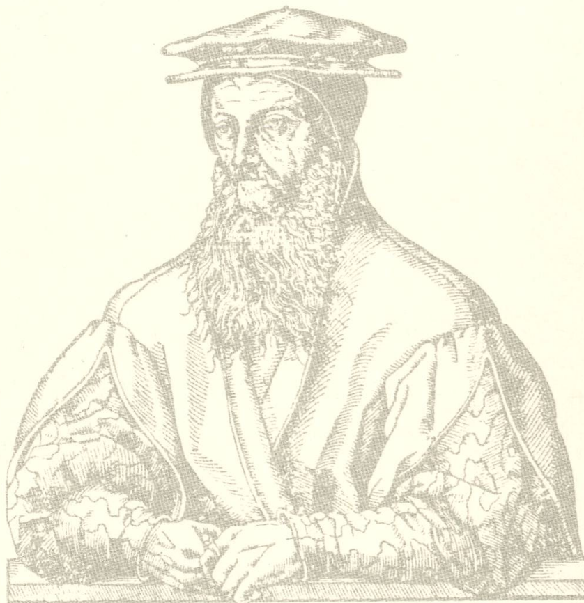
Conrad Gessner 1516–1565

Swiss Journal of the History of Medicine and Sciences Vol. 54 (1997) N° 1/2