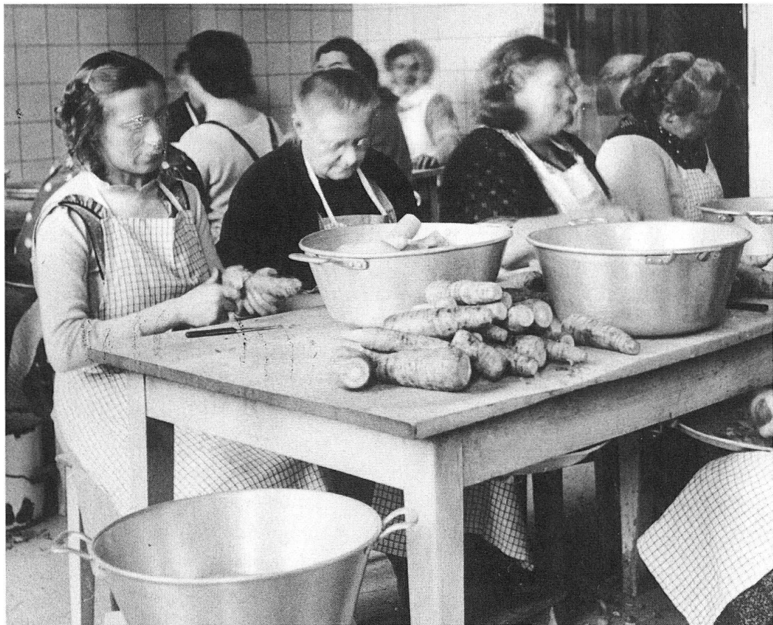
Abb. 4: Burghölzli-Patientinnen in der Gemüserüsterei, um 1940.

Museen beschäftigen sich mit der Vergangenheit – das Bild der Gegenwart trägt der Besucher in seinem Kopf. Ein gut gestaltetes Museum regt zu Vergleichen an. Die alte Psychiatrie erscheint sowohl idyllisch wie auch hilflos und dadurch grausam. Wie idyllisch, wenn Patienten und Pfleger