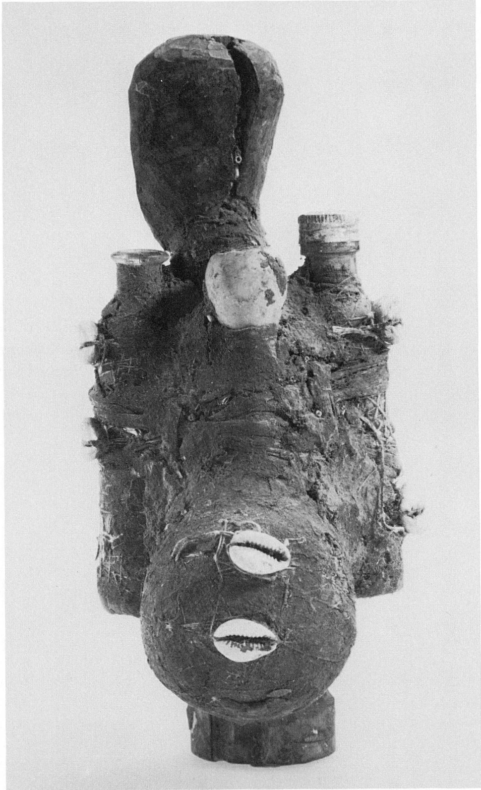
Abb. 2. Pocken-Fetisch aus Benin (dorsale Ansicht)