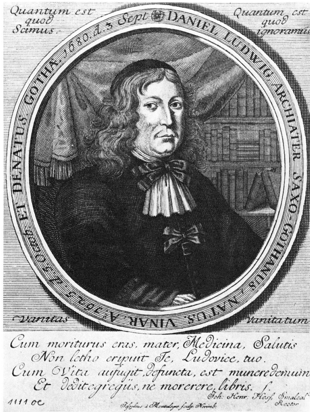
Abb. 1. Daniel Ludwig, Verfasser der « Pharmacia moderno Seculo accommodata »

mit einem Vorwort des berühmten D. Georg Wolfgang Wedelius und verschiedenen Ergänzungen handelt.