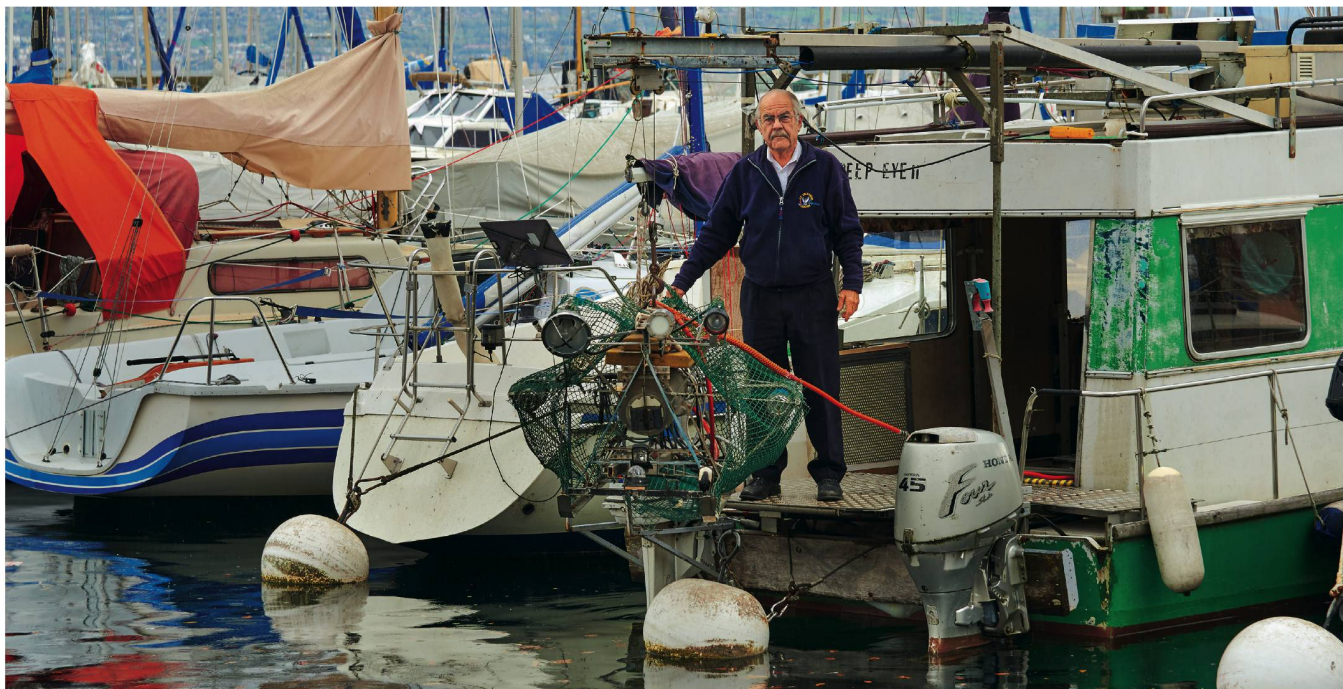
Le capitaine, son bateau et son fameux robot submersible.