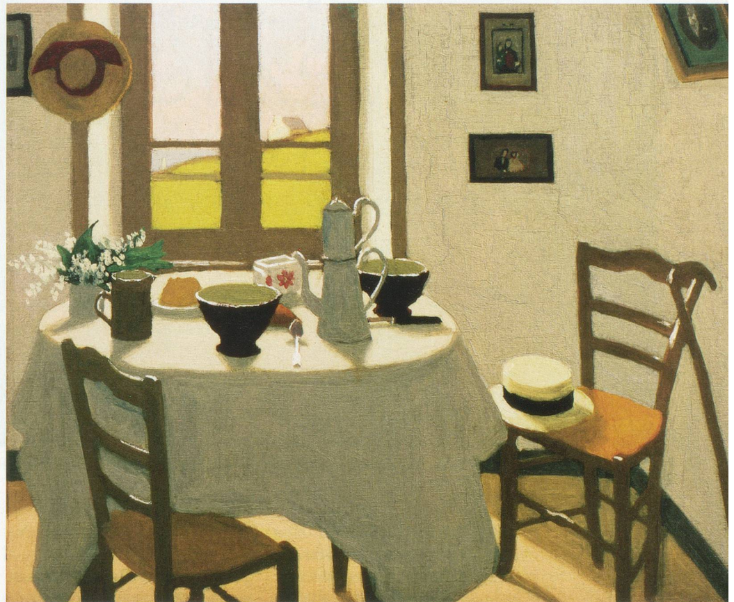
La chambre blanche, œuvre testament de Marius Borgeaud

Borgeaud parle de «l'en-nuyante ville de Lausanne» qu'il