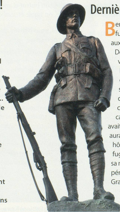
Awe Inspiring Images

B ernard Jordan, le vétéran britannique qui avait fugué de sa maison de retraite pour assister aux commémorations du 70 e anniversaire du Débarquement, s'en est allé pour un dernier voyage. En juin 2014, l'histoire de cet homme avait ému le monde entier. Il avait quitté en douce son établissement de soins dans le sud-est de l'Angleterre pour rejoindre ses anciens camarades en Normandie. Avec ses médailles cachées sous son manteau, l'intépide retraité avait emprunté seul un train et un ferry, où il en aurait même profité pour faire du charme aux hôtesses de bord. C'est après deux jours de fugue que le vétéran avait finalement regagné sa maison de retraite, devenant la star d'un périple que les médias avaient nommé «la Grande Evasion». Le 6 janvier 2015, Bernard Jordan a entrepris une dernière fugue vers l'au-delà, où il a sans doute rejoint ses frères d'armes.