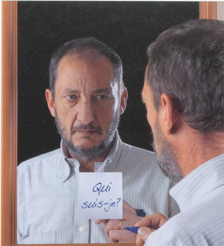
La maladie d'Alzheimer représente 50 % des démences.

elle-même, mais qui pallie certaines difficultés du début comme le manque d'attention par exemple. Il y a beaucoup d'essais cliniques pour tester de nouvelles molécules. Un jour, on gagnera.