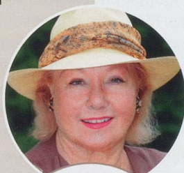
NADINE DE ROTHSCHILD,

« J'ai adoré ma grand-mère et ma mère qui m'ont donné une vie simple. J'habitais alors dans la banlieue de Paris et, à 14 ans, j'ai décidé de quitter la maison pour une chambre de bonne au 8 e étage. J'ai alors commencé à travailler dans une usine de voiture décapotables, voitures que j'ai du reste souvent reçues en cadeau dans ma vie, plus tard... Bref, j'estime ne rien devoir à personne! J'ai affronté la vie seule, mes erreurs, je me les dois, tout comme mes succès. Je crois avoir toujours su être bien accompagnée. De ma mère, qui travaillait dans les métiers de la laine, et de ma grand-mère, qui était boulangère et d'origine paysanne flamande, je dois d'avoir les pieds bien sur terre et des ambitions réalistes et réfléchies. A l'âge des aventures et des demandes en mariages, j'ai toujours su dire non, alors que les possibilités étaient nombreuses. Mais le jour où je suis tombée sur mon mari, j'ai su qu'il serait l'homme de ma vie, un grand seigneur. Un conseil aux jeunes filles? A l'heure où l'on consomme tous azimuts et avec grande rapidité, où l'on ne donne plus le temps aux hommes de rêver, je pense qu'il faut réapprendre à dire peut-être. Le meilleur passeport reste quant à moi toujours le même, la bonne éducation, même sans diplôme! Ma mère était très simple mais personne n'a jamais été autorisé à mettre ses coudes sur la table! Même si c'est prétentieux, je le répète: je ne dois ma réussite qu'à mon travail. Je n'ai donc personne d'autre à remercier que moi-même. »