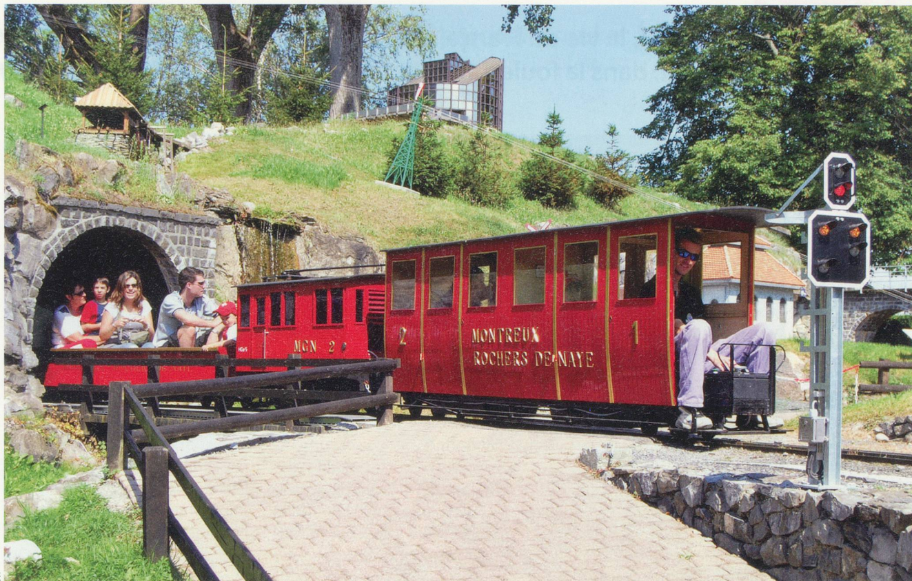
Petits et grands s'amuse avec les trains miniatures du Bouveret.