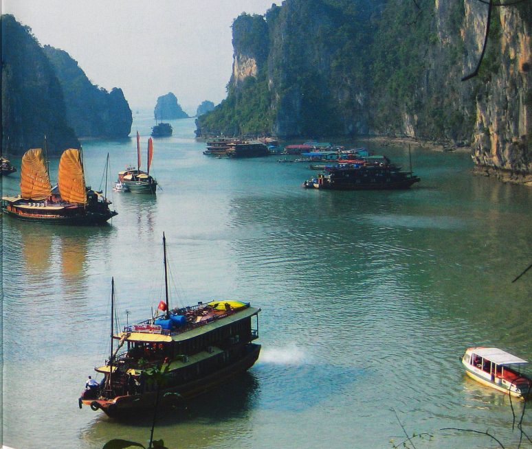
La baie d'Halong constitue l'une des merveilles du Vietnam, avec ses 3000 îles émergeant des eaux vert émeraude du golfe du Tonkin.