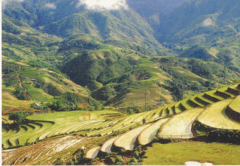
Dans la région de Sapa, au nord-ouest du Vietnam, les rizières sculptées à même les reliefs contribuent à entretenir la splendeur de cette contrée montagneuse.

vent, à la fin des années septante, les mesures de rétorsion (saisies de biens...) décidées par le gouvernement.