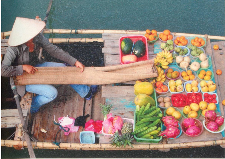
La région du delta du Mékong est réputée pour sa fertilité. La variété des fruits et légumes très colorés que l'on trouve sur les marchés flottants en est la preuve.