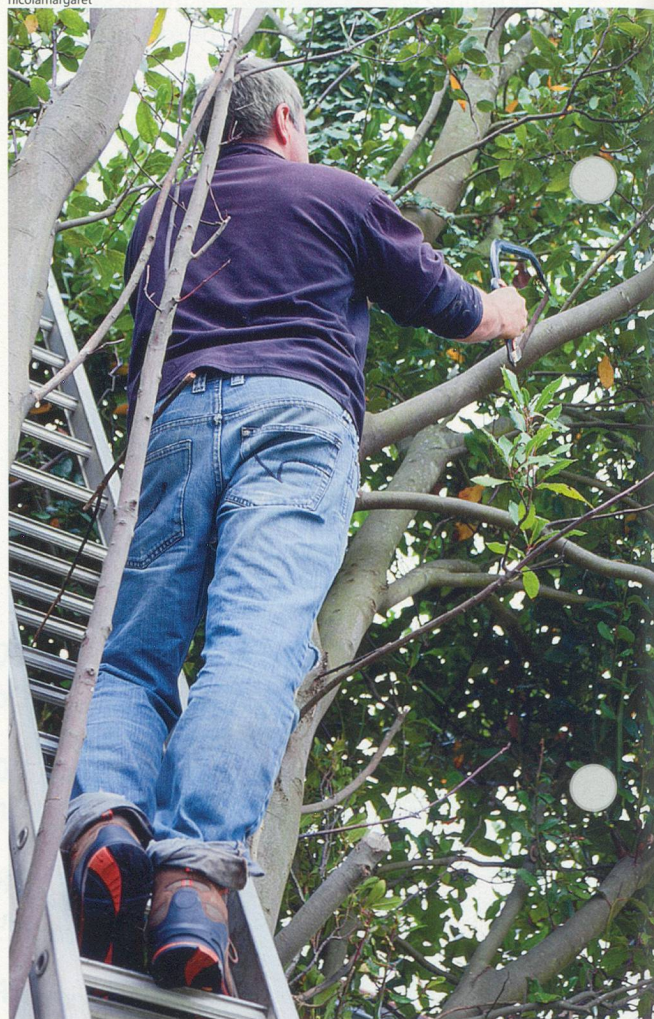
Même avant de tailler des branches qui vous font de l'ombre, il vaut mieux s'arranger avec le voisin.

oppositions étant possibles; elle est également susceptible de recours. En cas de non-respect du règlement communal, des amendes sont prévues.