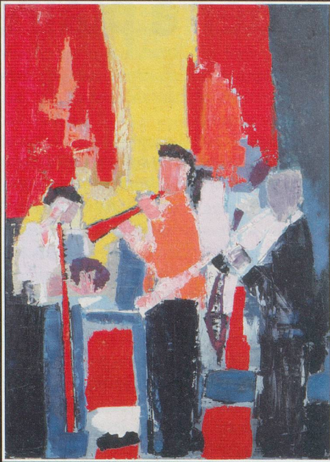
© 2010 ProLitteris Zürich. © ADAGP. © Collection Centre Pompidou, Dist. RMN / Georges Maguandichien.

Fondation Pierre Gianadda Martigny Suisse