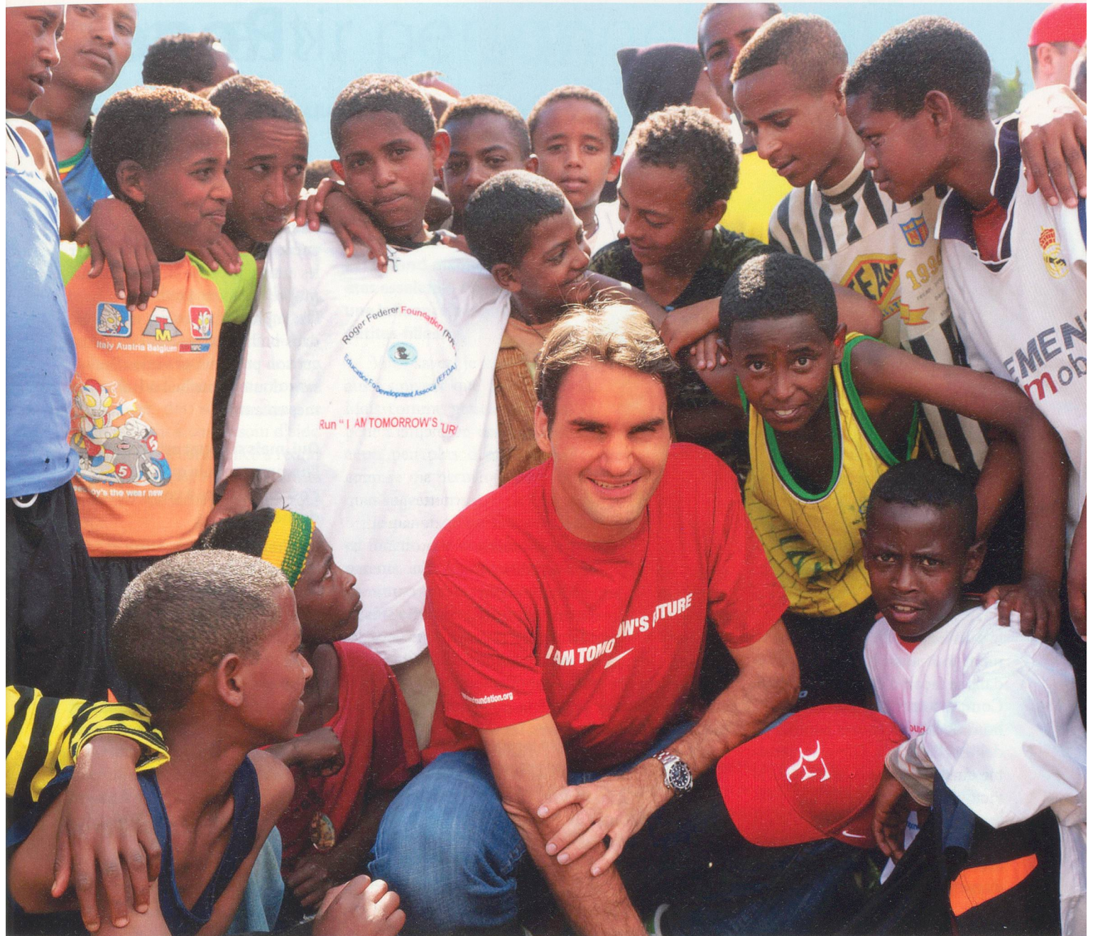
Roger Federer Foundation

Roger Federer ne se contente pas de penser aux défavorisés. Il va aussi à leur rencontre comme ici au début de l'année en Ethiopie, un des pays où sa fondation intervient pour soutenir l'éducation des enfants.