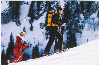
Charmey a balisé plusieurs parcours pour les amateurs de randonnées à raquettes.

« Nous avons aussi pris nos skis et nos raquettes », précise Yvonne, 72 ans, une silhouette de sportive assidue. Car si la Gruyère est surtout connue pour son château, ses vaches et ses promenades estivales, la région a bien compris l'intérêt de développer le tourisme d'hiver. A Charmey, il y a la télécabine pour Vounetz (1630 m) avec ses quelques pistes de ski alpin. Mais il y a aussi les sentiers pour raquettes qui rencontrent un succès