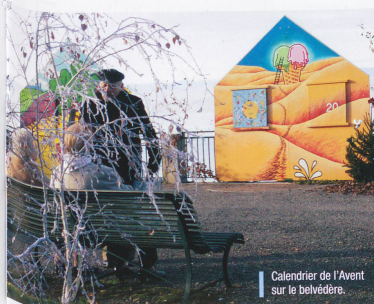
Calendrier de l'Avent sur le belvédère.

deux pas de cette terrasse, l'Office du tourisme a pris ses nouveaux quartiers dans le Château de Sonnaz qui abrite également le Musée du Chablais. Malheureusement, les collections ne sont pas visibles en ce mois de décembre, car le musée est en réfection. Il faudra donc remettre la visite – notamment de la salle consacrée aux objets de contrebande par le lac et la monta-