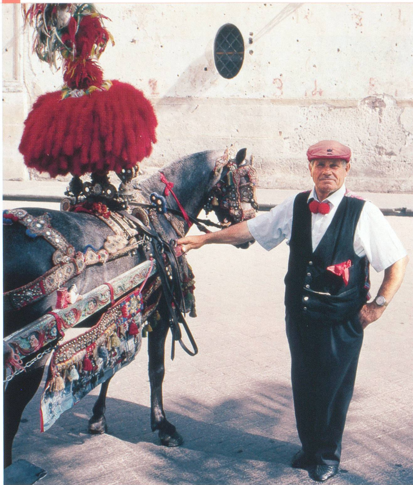
Les calèches de Monreale ne sont pas utilisées que pour les touristes.