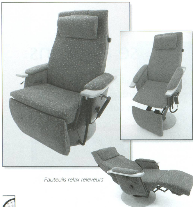
Fauteuils relax releveurs

Des professionnels au service de personnes handicapées ou âgées