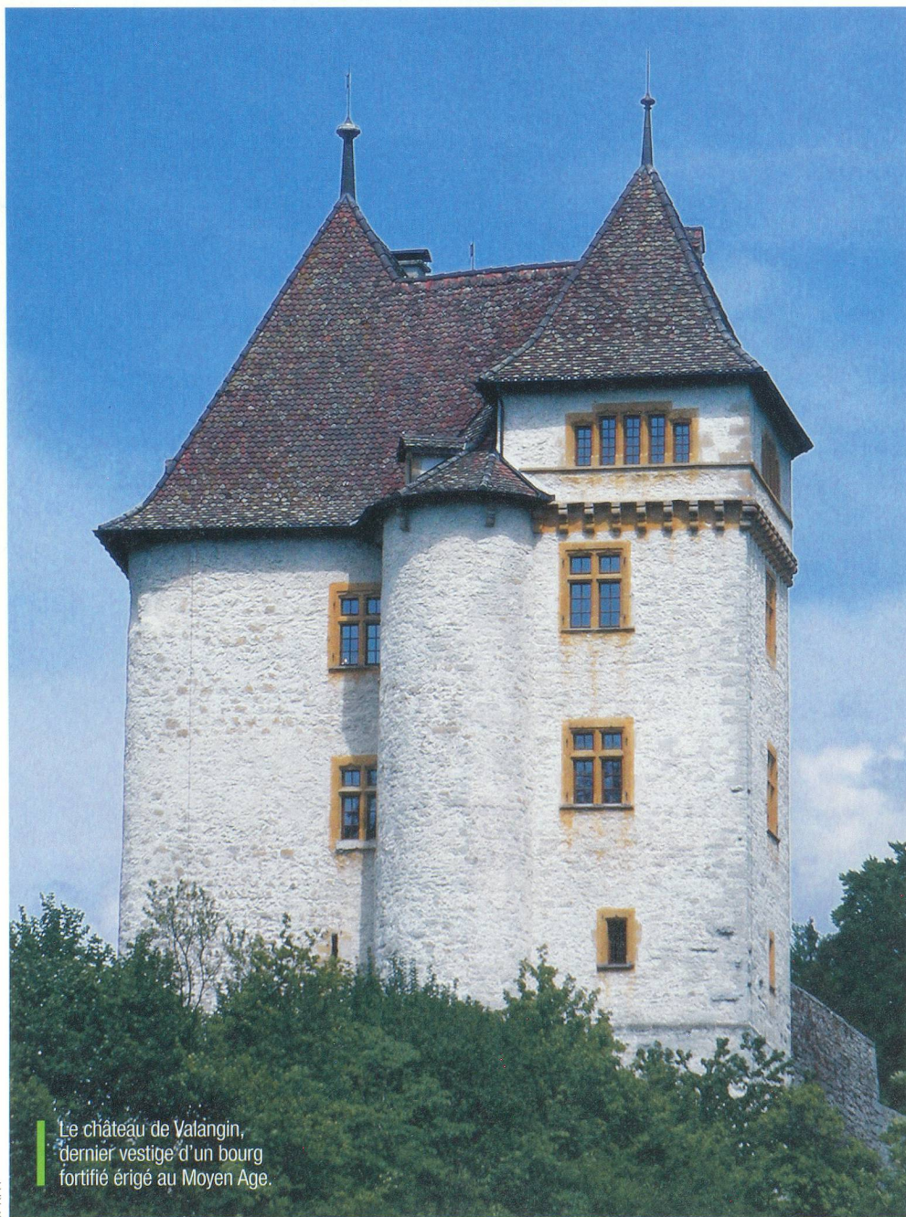
Le château de Valangin, dernier vestige d'un bourg fortifié érigé au Moyen Âge.

Construit sur un éperon rocheux, à l'extrémité du bourg fortifié, le château de Valangin n'aurait pas fait rêvé Walt Disney. Il s'agit d'un énorme donjon flanqué de deux tours datant, sous sa forme actuelle, de 1772. Passé la porte principale, il faut grimper par un chemin qui louvoie entre les ruines de l'ancien édifice. Une porte à serrure électronique barre l'accès aux visiteurs. Pour atteindre le petit bureau d'accueil, on doit montrer patte blanche. Le voyage dans le passé débute par la cuisine. Une vaste cheminée, surmontée d'un tourne broche muni d'un mouvement d'horlogerie, semble espérer un agneau ou une pièce de bœuf depuis la nuit des temps. Les fers à bricelet,