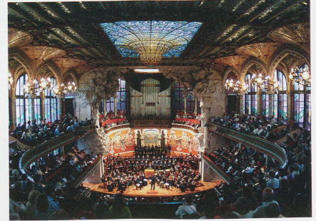
Le Palais de la Musique fête ses 100 ans.

Les fées de l'architecture se sont penchées sur le berceau de Barcelone et l'ont parée des plus admirables réalisations. Gaudi et ses successeurs ont rendu cette cité unique et chatoyante.