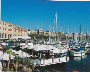
Manquer à Barcelone, au port ou au marché de la Boqueria.