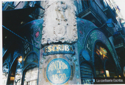
La confiserie Escriba.