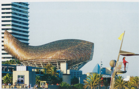
Architecture moderne: Gehry et Nouvel en maestria.