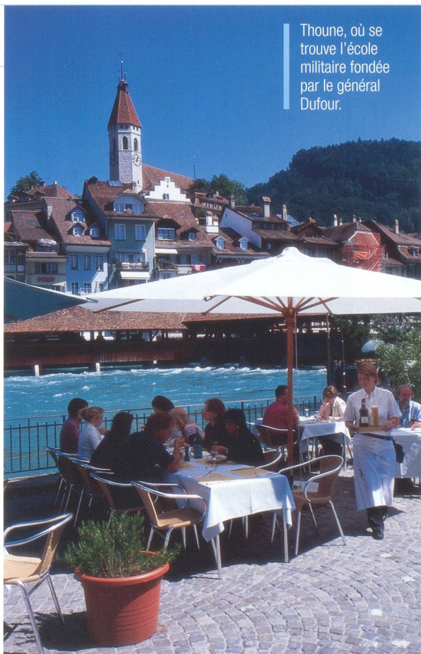
Thoune, où se trouve l'école militaire fondée par le général Dufour.