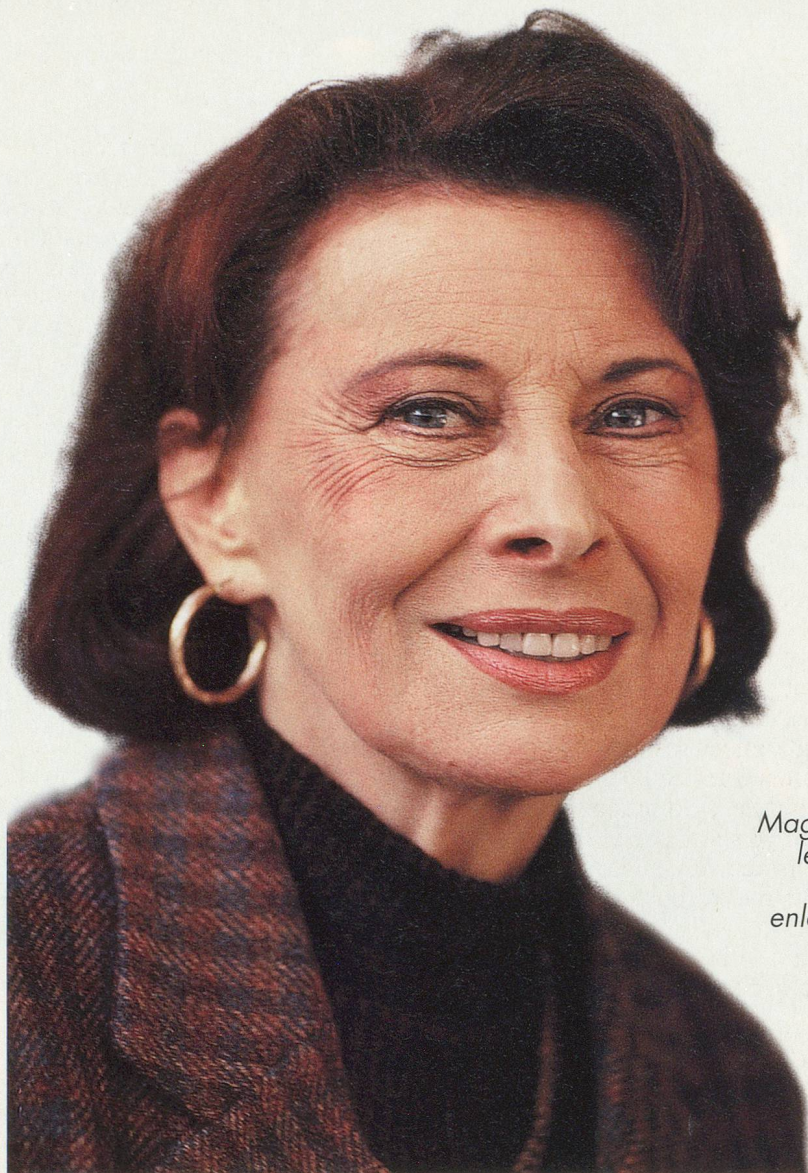
Magali Noël: les années n'ont rien enlevé à son charme