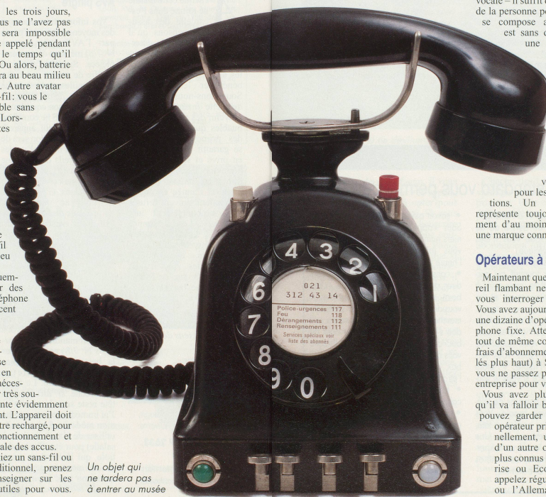
Un objet qui ne tardera pas à entrer au musée

Deuxième possibilité: vous choisissez de faire passer tous vos appels par un autre opérateur. Vous vous affiliez à Sunrise, par exemple. Après votre inscription, il ne vous sera plus nécessaire de taper un code. Vos appels seront directement acheminés par l'opérateur, qui en avertit Swisscom. La facture de tous vos appels vous parviendra via Sunrise. Rien ne vous empêche d'employer en parallèle les services de plusieurs opérateurs, si le cœur vous en dit. Evidemment, ces sociétés ont intérêt à vous avoir comme client régulier. Ils vous proposeront donc tous, avec plus ou moins d'insistance, de passer tous vos appels par eux. Dans leur