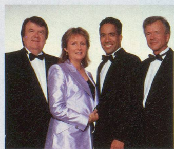
Alain Morisod et Sweet People

Inclus dans le prix: transfert par TGV Genève-Cannes et retour, billet CFF dès votre domicile, hébergement en cabine double, cocktail du commandant, pension complète, boissons comprises, dîner de gala, animations, sports, accompagnant au départ de Suisse. (Non compris: assurance annulation, boissons hors des repas, excursions facultatives, dépenses personnelles, taxes portuaires).