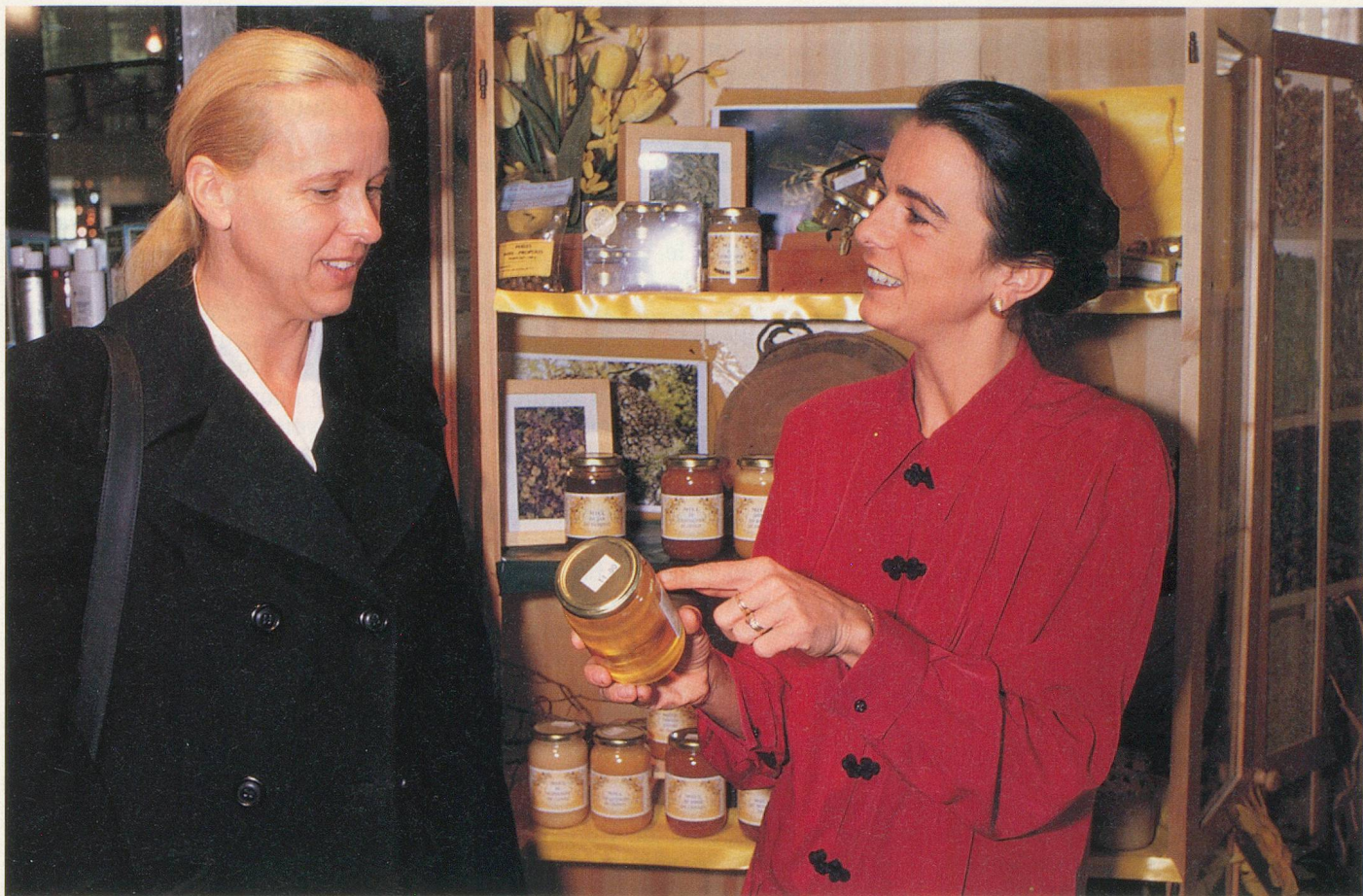
Les miels les meilleurs, sélectionnés par une apicultrice, sont en vente à L'institut

recette, une préparation de plantes, le plus souvent en tisanes à boire tout au long de la journée. Je suis l'évolution et je peux modifier la posologie en fonction des réactions du malade. Le travail se fait à long terme.