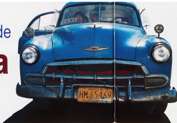
La belle américaine, carrosserie restaurée et moteur fatigué...

Impossible d'acheter une voiture à Cuba. Question de prix et de lois. Seul l'Etat est autorisé à acquérir des véhicules automobiles. Heureusement, il existe un réseau de transports improvisé.