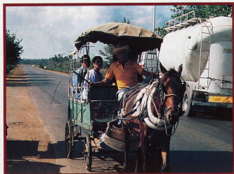
Dans la campagne cubaine, la carriole attelée est le plus sûr moyen de transport

Renseignements: Carlson Wagonlit Travel, Gare CFF, 1001 Lausanne. Tél. 021/320 72 35.