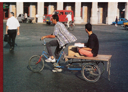
Tous les moyens sont bons pour se déplacer dans les rues de La Havane