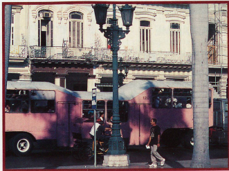
Trois cents passagers se serrent dans les célèbres bus roses, baptisés «chameaux»