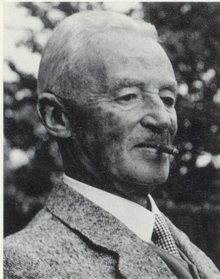
d'hui, sa propriété de Verte-Rive, à Pully, abrite le Centre Général-Guisan.

Cette mission a amené le général Guisan à prendre les décisions stratégiques dictées par la situation et son évolution tout au long de son temps de commandement. Le 20 août 1945, il quittera son commandement avec le sentiment du devoir accompli. L'estime de tout un peuple lui restera acquise jusqu'à sa mort, en 1960, et au-delà. Aujourd'hui, sa propriété de Verte-Rive, à Pully, abrite le Centre Général-Guisan.