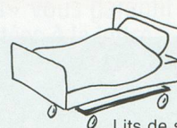
Lits de soins