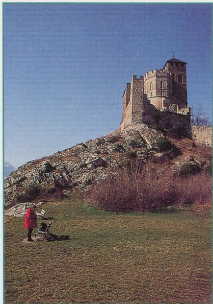
1. – Cette église se trouve sur une colline valaisanne. Quel est son nom?

Pour les rares journées pluvieuses de l'été, nous vous proposons un concours doté de superbes prix. Les questions ne sont pas trop difficiles, mais il faudra tout de même chercher. Elles concernent tous les cantons de Suisse romande.