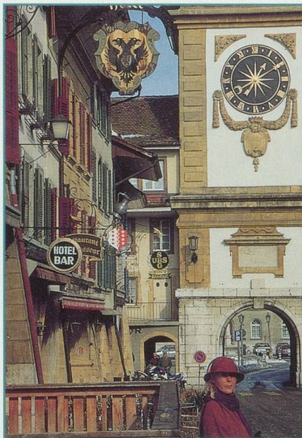
2. – Charles-le-Téméraire détestait cette ville. L'avez-vous reconnue?