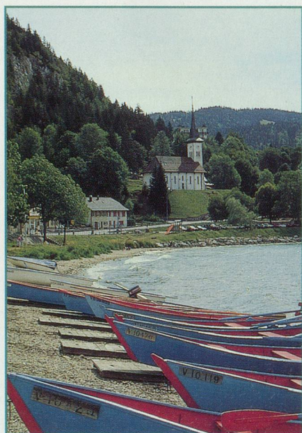
3. – Comment s'appelle ce petit lac situé dans le canton de Vaud?