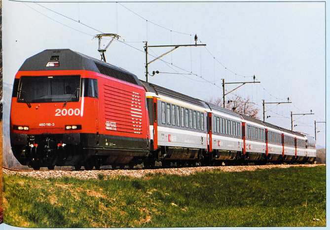
Une composition EuroCity, dernière-née des CFF