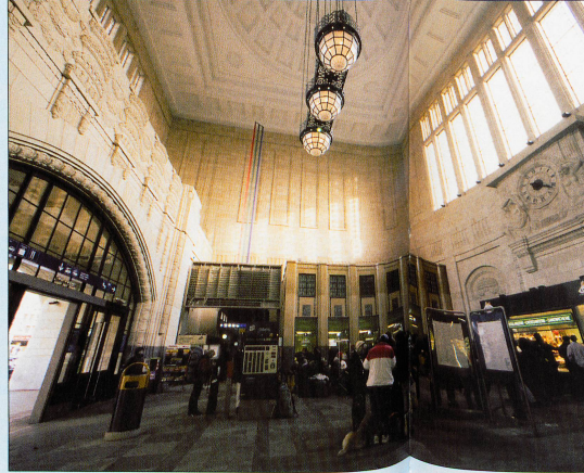
La gare de Lausanne, rénovée, sera inaugurée en avril