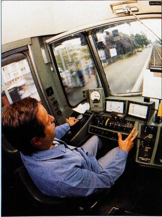
Dans la cabine de pilotage d'une locomotive moderne