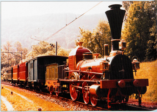
Le «Spanisch-Brölly-Bahn», mis en service en 1847