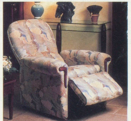
«Alicante», le dernier-né d'Everstyl

Fauteuil «Alicante», proposé dès Fr. 2140.- dans les boutiques Everstyl de Bâle, Berne, Genève et Lausanne. Renseignements et conseils au tél. 061/691 50 20.