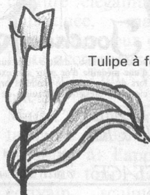
Tulipe à feuilles striées

Pour les massifs, laissez le hasard vous réserver de belles surprises printanières: renversez en vrac vos bulbes au fond d'un grand trou rond, tournez-les tous pointe en l'air, recouvrez de terre et attendez. Dans un massif planté de variétés tardives, dégagez le centre du trou et plantez de l'ail d'ornement: les hampes poussent leur boules de fleurs pourpres, lilas, violettes, bleues à près de 120 cm.