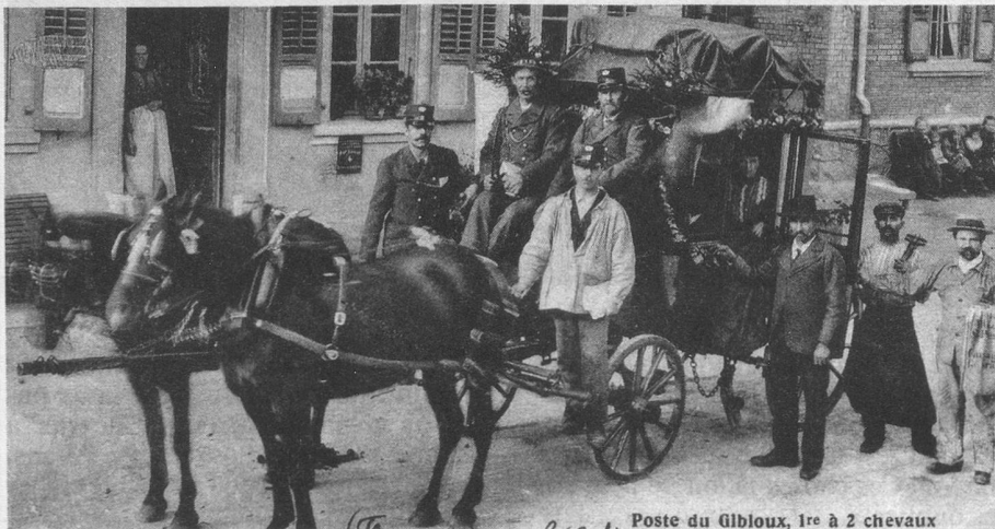
Poste du Gibloux, 1re à 2 chevaux

«Pour éviter la catastrophe nous avons fait tout ce qu'il était possible de faire. Nous avons prêté l'oreille à toutes les offres de médiation... Mais les heures se sont écoulées sans que vint une réponse de la Wilhelmstrasse . Les troupes allemandes avançaient en Pologne ... manifestement l'Allemagne hitlérienne est résolue à conquérir la Pologne pour se jeter sur nous.»