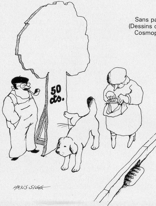
Sans paroles (Dessins de Sigg- Cosmopress)