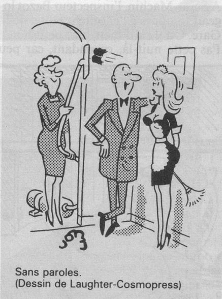
Sans paroles. (Dessin de Laughter-Cosmopress)