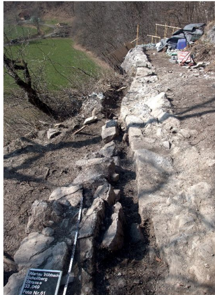
Abb. 6: Der archäologische Befund bereitet die Rekonstruktion vor: älteres (rechts!) und jüngeres Brüstungsmauerfundament am oberen Ende der Hohwand (Maja Widmer 2011).

Alle diese Arbeiten finden wegen des fehlenden Bewuchses und der günstigen Lichtverhältnisse im Winter und Vorfrühling statt. Dagegen wird die archäologische Baubegleitung während des Bauvorgangs durchgeführt. Sie dient der Abklärung von einzelnen Befunden,