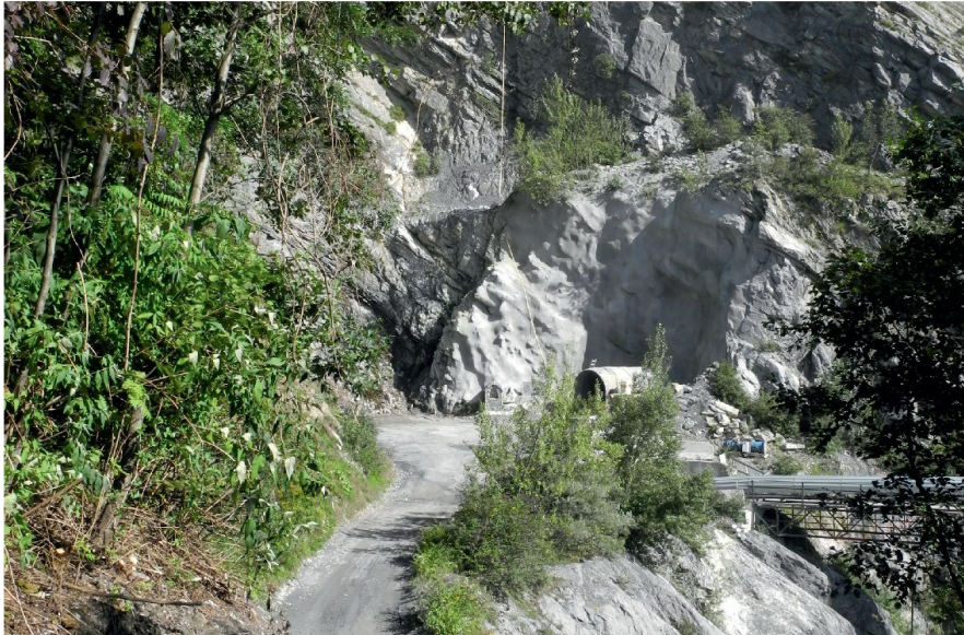
Abb. 8: Der neue Verbindungsweg durch den nördlichen Steinbruch. Der gegen Steinschlag gesicherte südliche Stolleneingang befindet sich im Hintergrund des Bildes unter der Felswand. Der Stollen wurde zu Ehren der St. Galler Ständerätin Karin Keller-Sutter auf den Namen «Karin-Tunnel» getauft (Cornel Doswald 2014).

in seiner vollen Breite gezeigt werden soll, um die historischen Dimensionen der Strasse erfahrbar zu machen. Anschliessend erfolgt die Restaurierung der historischen Bauteile durch Ergänzung