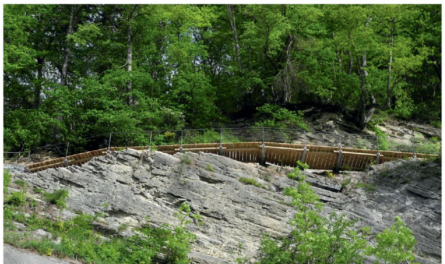
Abb. 7: Das weitgehend zerstörte Strassenstrasse durch den südlichen Steinbruch wurde mit einem modernen Steg überbrückt. Dieser ist wegen der durch Steinbrucharbeiten destabilisierten Felsformationen unterhalb des Trassees direkt in der Felswand verankert und schwebt so gleichsam über dem ursprünglichen Trassee.

die dann zur Festlegung der konkreten Restaurierungsarbeiten führt (Abb. 6). Soweit noch historische Bausubstanz vorhanden ist, gilt es, laufend vom Befund zu lernen. Erst nach der archäologischen Freilegung wurden etwa das Strasseniveau und der Verlauf der Brüstungs-