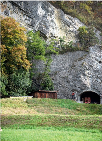
Abb. 5: Die eingewachsene Strassenstrecke durch die Hohwand vor Beginn der Restaurierung (Cornel Doswald, 2010).

und für die archäologische Befundreferenzierung in der dritten Etappe ergänzt. Auf dieser Basis wurde für die erste Etappe ein archäologisch-topographischer Plan im Massstab 1:500 aufgenommen, der nicht nur für die Einmessung der archäologischen Befunde, sondern auch als Grundlage für den technischen Massnahmenplan benutzt wurde. Parallel dazu wurde eine Kampagne mit archäologischen Sondierungen des Strassenquerschnitts durchgeführt. Entsprechende Sondierungen werden auch die dritte Etappe vorbereiten. Sie beschränken sich auf die Eingriffe, die für die Abklärung des Befundes erforderlich sind, und erbringen wertvolle Informationen zur Breite der Strasse, dem Aufbau des Strassenkörpers und der Stützmauern sowie der Baugeschichte. Wo die Strasse gepflastert und ihre Oberfläche intakt ist, werden keine Eingriffe unter das jüngste Pflaster ausgeführt.