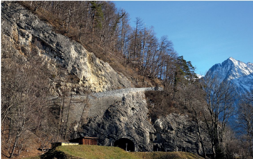
Abb. 1: Die alte Schollbergstrasse in der grossen Hohwand nach der Wiederherstellung (Cornel Doswald, 2012).

Die baulichen Überreste der alten Schollbergstrasse sollen in Übereinstimmung mit dem historischen und archäologischen Befund und in Übereinstimmung mit einer korrekten denkmalpflegerischen Praxis instand gestellt werden. Gemäss den Grundsätzen der Vollzugshilfe «Erhaltung historischer Verkehrswege» bedeutet das, dass unberührte archäologische Strukturen und gut erhaltene Bauteile erhalten und wo nötig konserviert werden. Zerfallende Bauteile werden ergänzt und soweit erforderlich in traditioneller Handwerkstechnik erneuert. Unterbrochene Abschnitte werden dagegen nicht rekonstruiert, sondern im Sinn einer funktionalen Wiederherstellung in zeitgemässen Techniken ergänzt (Abb. 7).