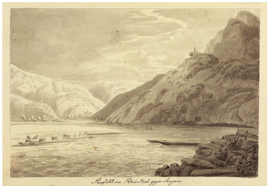
Abb. 2: Der beinahe kahle Felsbuckel des Schollbergs mit der ausgedehnten Wasserfläche des unkorrigierten Rheins im Vordergrund, links im Hintergrund das Städtchen Sargans. Auf halber Höhe des Hangs erkennt man den exponierten Strassenverlauf («Aussicht ins Rheinthal gegen Sargans»). Johann Heinrich Schilpach 1818. Liechtensteinisches Landesmuseum, Foto S. Beham).

Nach Vorbereitungsarbeiten wurden in den Jahren 2010–2012 die Arbeiten im Bereich zwischen Hohwand und Steinbruch Schollberg auf dem Gemeindegebiet Wartau durchgeführt und erfolgreich abgeschlossen. Dabei erhielt das Projekt mit der wiederhergestellten Strassenrampe durch die Hohwand ein weithin wahrnehmbares Gesicht (Abb. 1) und mit dem neuen Steg durch den südlichen Steinbruch einen neuen Anziehungspunkt (Abb. 7). In den Jahren 2013–2014 wurde mit der Durchquerung