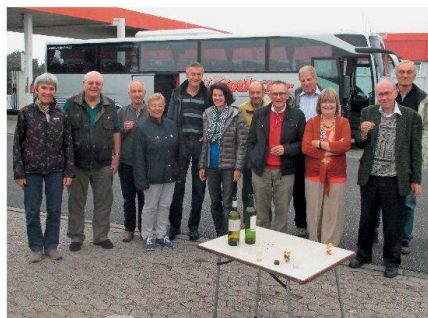
Abb. 1: Die Reisegesellschaft.

Der erste Ausflug führte nach Zwolle, wo sich eine Zweigstelle des Kadasters befindet, der jedoch sein Hauptquartier im benachbarten Apeldoorn hat. GIN und Kadaster wurden uns