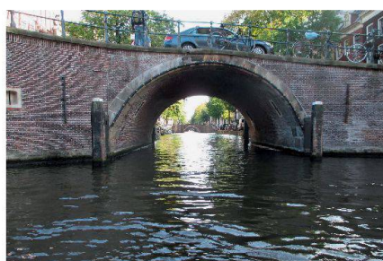
Abb. 7: Amsterdams Grachten (einziger Standort mit Blick durch eine und zu sieben Brücken).

Dann folgte Amsterdam, die unvergleichlich pulsierende Hauptstadt, in der alle Macht den Radfahrern gehört. Eine sehr kompetente Führerin machte uns mit der frühen Geschichte und Sehenswürdigkeiten der Altstadt bekannt. Eine geruhsame, kommentierte Grachtenfahrt führte uns durch das Kanalsystem und rundete das Bild ab (Abb. 7). Ein perfektes Steak in einem der unzähligen Restaurants jeglicher Provenienz, sorgte dafür, dass der Tag auch kulinarisch erfolgreich abgeschlossen werden konnte.