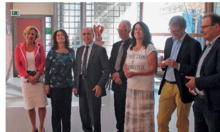
Abb. 8: Unsere Gesprächspartner in Wageningen.

Ein weiterer Höhepunkt folgte am zweitletzten Tag im Campus der Universität Wageningen. Unsere holländischen Kollegen weihten uns in ihr Konzept betreffend die Ausbildung vom Vor- bis zum Hochschulalter und die permanente Weiterbildung ein. Holland leidet, wie praktisch alle europäischen Länder, unter Nachwuchsmangel. Zunächst wurden vor