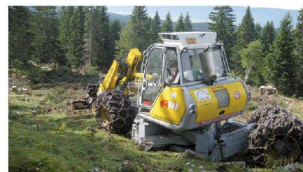
Fig. 12: Nettoyage des branches après une coupe sur pâturage.

La plupart des projets d'aménagement bénéficie de contributions publiques. Les autorités qui allouent des fonds publics