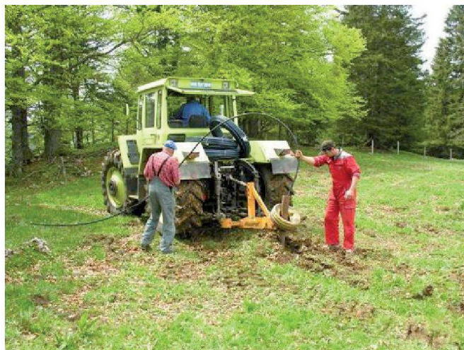
Fig. 7: Pose de conduites à la soussoleuse.