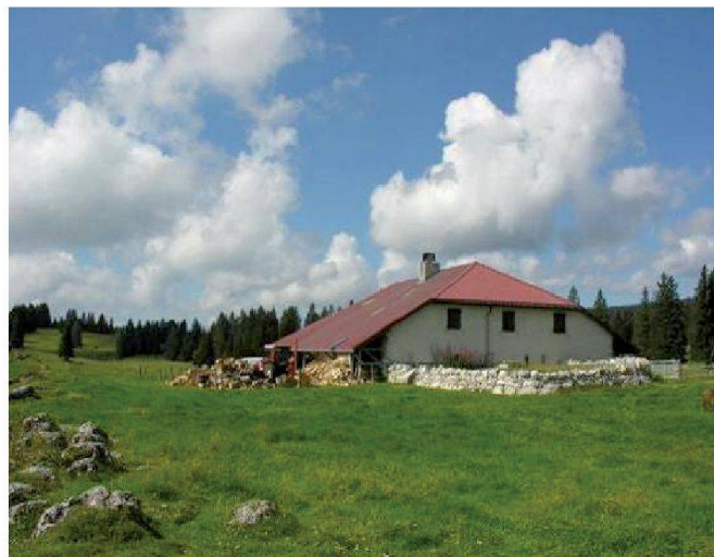
Fig. 9: Citerne alimentée par une toiture.