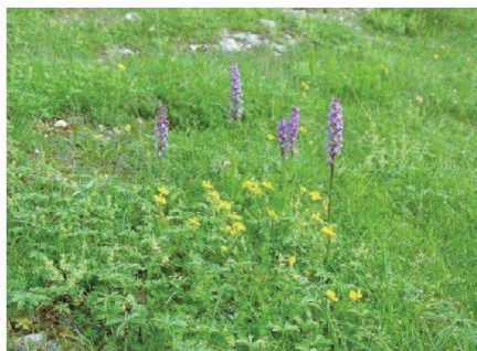
Fig. 11: Pâturage sec riche en orchidées.

tème de pâture et de la maîtrise du rajeunissement du bois et des coupes régulières.