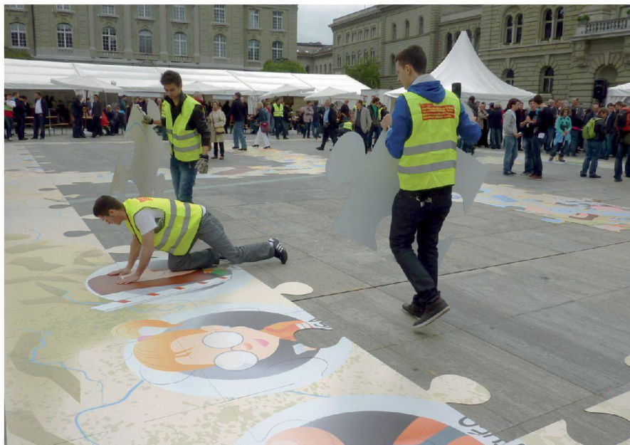
Bern, 9. Mai 2012: Jubiläumsauftakt auf dem Bundesplatz. Berne, 9 mai 2012 coup d'envoi des festivités sur la place fédérale. Berna, 9 maggio 2012: lancio dell'anniversario a Piazza federale.

oder dem ÖREB-Kataster werden zusätzlich angeboten. Neu wurde auch der Lehrgang «Operateur/in für Geoinformationssysteme» auf die Beine gestellt.