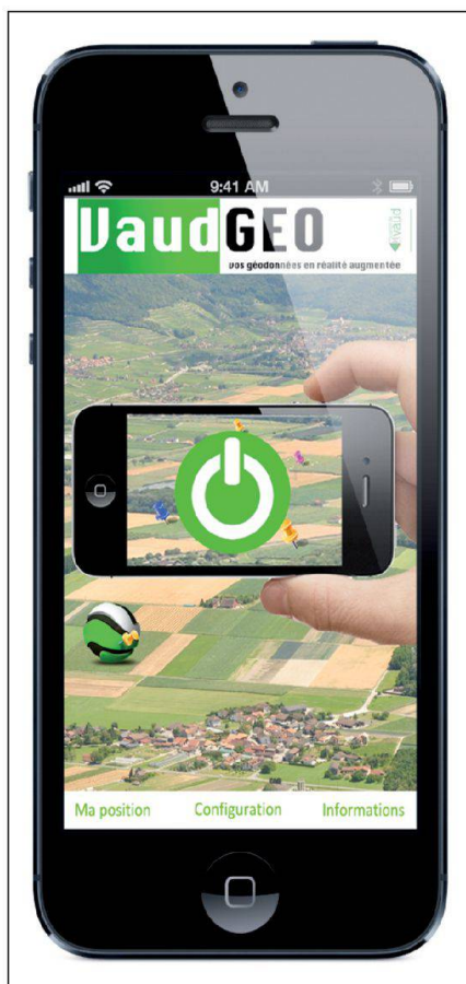
Fig. 1: Menu de VaudGeo. Abb. 1: Hauptmenü VaudGeo. Fig. 1: Menu di VaudGeo.

Développée dans le cadre d'un travail de diplôme de technicien en géomatique pour le compte de l'Office de l'Information sur le Territoire de l'Etat de Vaud, l'application VaudGeo est mise à disposition dès le début de l'automne 2013, et téléchargeable gratuitement sur l'App Store.