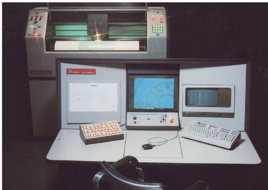
Abb. 1: SCITEX Superscanner und Grafikstation Response 280.

Neben der Erfassung der Daten für ein Geländemodell erhielten wir unerwartet einen interessanten externen Auftrag. Die Schweizerische Rettungsflugwacht REGA benötigte einen geeigneten Datensatz der Schweiz zur Integration in das Navigationssystem ihrer neuen Rettungs-Helikoptern. Ein Hybridsystem mit Videobil-