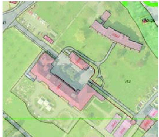
TOPIC Bodenbedeckung mit Orthofoto.