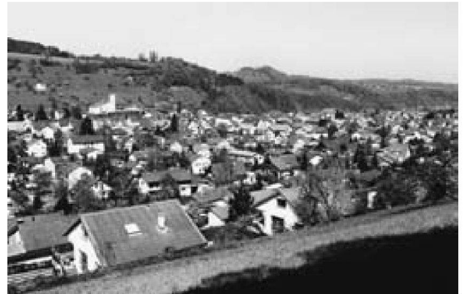
Abb. 2 und 3 : Wandel von Bubendorf (BL) zwischen 1915 und 1989: Die Siedlung hat flächig zugenommen, der Wald punktuell (Bildquelle: aus Karl Martin Tanner «Augen-Blicke»).

wichtigste Aufgabe des Waldes, gefolgt von der ökologischen Funktion, der Erholung und dem Schutz vor Naturgefahren. Der Wald scheint ein bevorzugter Freizeit- und Erholungsraum zu sein. So gehen im Sommer durchschnittlich gegen 60% der Bevölkerung und im Winter knapp 40% mindestens einmal pro Woche in den Wald. Die durchschnittliche Aufenthaltsdauer in der «Arena» Wald beträgt 90 Minuten, was der Dauer eines Fussballspiels entspricht.