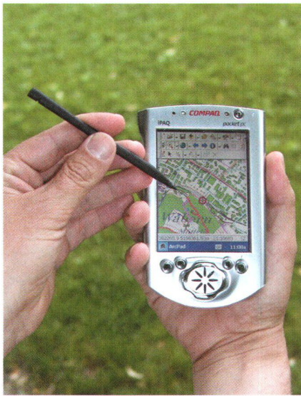
Fig. 4: Géodonnées mobiles.

Vous retrouverez l'essentiel de ces informations en parcourant la brochure qui accompagne notre programme e-geo.ch.