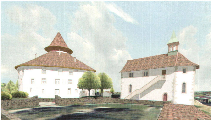
Abb. 1: Virtuelles 3D-Modell des Schlosses Zwingen (Blockkurs 2000).