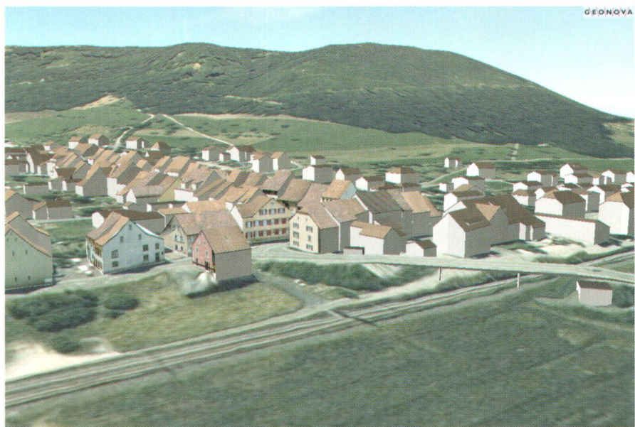
Abb. 2: Realitätsnahes 3D-Stadtmodell von Itingen BL im 3D-Viewer der FHBB-Spin-off-Firma GEONOVA AG (Blockkurs 2001).

Zürich in allen Disziplinen das dreistufige Ausbildungskonzept Bachelor-Master-Doktorat eingeführt. Dabei müssen die konventionellen Studiengänge nach Inhalt und Form neu überdacht werden. In diesem Kontext entstehen nicht nur neue Ausbildungsstrukturen und Lehrformen, sondern durch neue Partnerschaften auch neue Studiengänge. So entwickelten sich auch am Departement für Bau, Umwelt und Geomatik neue Studienprogramme. Im Wintersemester 2003/04 startet das Departement mit neuen Bachelorprogrammen in Bauingenieurwissenschaften, Umweltingenieurwissenschaften und Geomatik und Planung. Beim Bachelor in Geomatik und Planung geht es nicht um ein spezialisiertes Geomatikstudium, sondern auch der Planung und dem Landmanagement wird ein grosser Raum zugewiesen. Somit handelt es sich hier um ein breit angelegtes Angebot, welches eine gute Basis darstellt für verschiedene Spezialisierungsoptionen im Rahmen eines Masterstudiums (siehe auch www.geomatik.ethz.ch/BscGeoV280103.pdf ). Die Photogrammetrie ist mit den Pflichtfächern Photogrammetrie GZ und der Fernerkundung im Umfang von 84 Kontaktstunden sowie mit 112 möglichen Kontaktstunden aus dem Wahlfachbereich und einer 112-stündigen Bachelor-