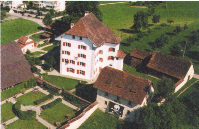
Abb. 3: Luftaufnahme vom Schloss Buttisholz.