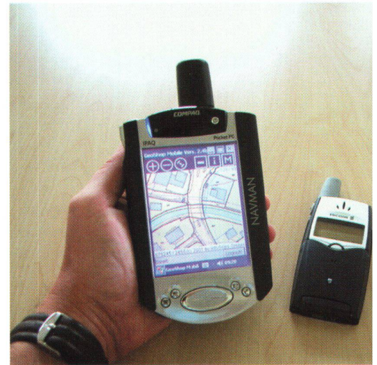
Abb. 3: GeoShop Mobile Client mit GPS-Unterstützung.

Die Firma ARIS AG Zürich bietet unter der Adresse www.geoservices.ch diverse Dienste im Umfeld der Geodaten an. Für den Datenliefer- bzw. Viewerdienst setzt die Firma ARIS AG den GeoShop ein. Die Kunden der ARIS AG (Ingenieurbüros) können ihre Daten selbstständig auf den ARIS-Server laden. Der Betrieb und die Konfiguration des Servers wird von der Firma ARIS zentral gemanaged. Die ARIS-Kunden können so auf einfache und kostengünstige Art ihre Geodaten im Internet publizieren bzw. verkaufen. Die ARIS AG wird durch die Mandantenfähigkeit, automatische Registrierung der Bestellungen, beliebige Skalierbarkeit bzw. einfache Systemadministration des GeoShops optimal beim Aufbau ihrer Dienstleistungen unterstützt.