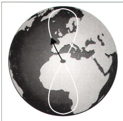
Fig. 3: Trace d'une orbite de type IGSO.

De nombreuses combinaisons de constellations sont à l'étude en tenant compte des coûts de lancement des satellites, des exigences des stations de contrôle et de la qualité de la configuration géométrique