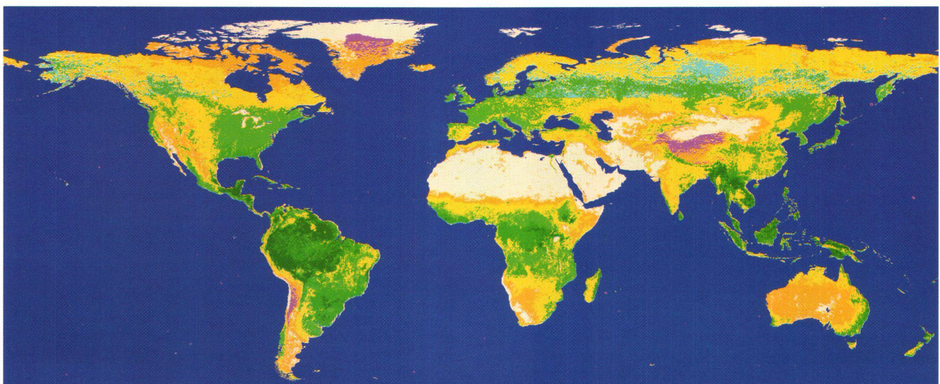
Fig. 2: Végétation mondiale.

Alors que les données peuvent être obtenues sans frais du GRID, les utilisateurs sont tenus de donner certaines informations concernant l'usage prévu des données obtenues et, dans les cas où leur