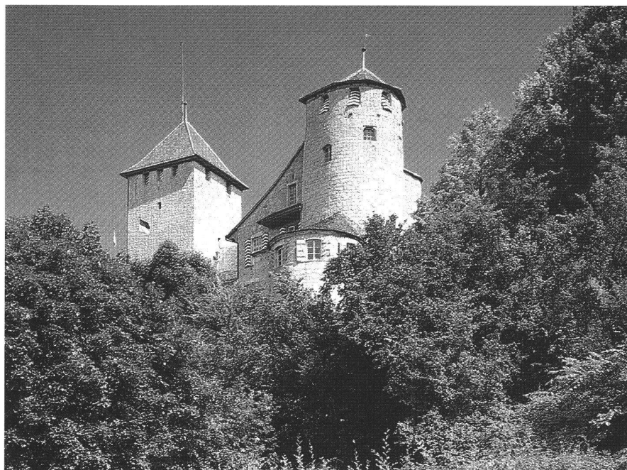
Schloss Murten. Bauwerk aus der Savoyerzeit mit dem massiven viereckigen Donjon. Château de Morat. Construction de l'époque avoyarde comportant un massif donjon carré.

En 1995, le numéro 5 de MPG sera consacré entièrement au thème «Commune '95». Cette édition spéciale a pour but de mieux familiariser les communes avec les prestations de service qu'offrent toutes les professions de la mensuration. L'ASPM se présentera